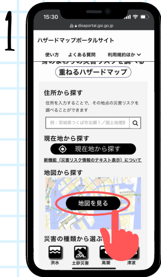
Haga click en "地図を見る"