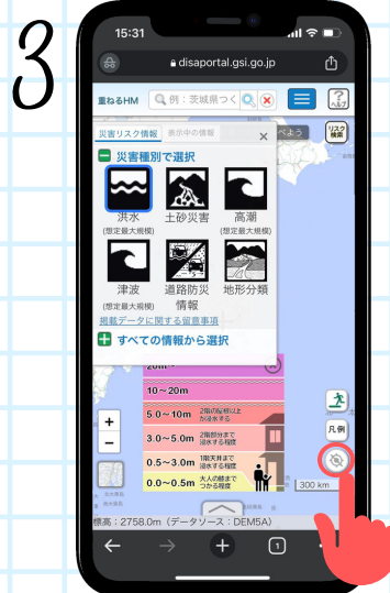
Haga click en el botón de ubicación actual.

*Revise el mapa cuando está en su domicilio así como en lugares que va con frecuencia.