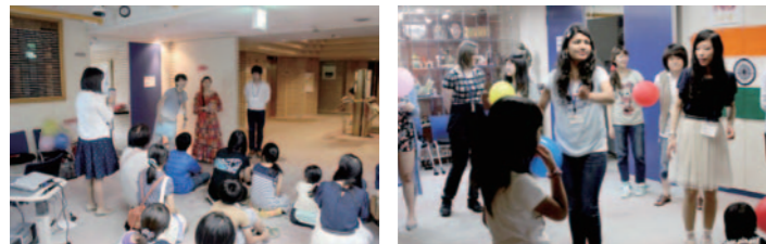
교류 살롱에서 실시하는 교류 사업