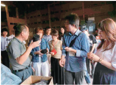
カラマツの炭化について説明を受けた

午前中に講義では、下川町職員より、町における環境への取り組み内容についてそれぞれ丁寧に解説をいただき、留学生は皆熱心に耳を傾けていた。その後は、役場裏熱供給施設や木質原料施設などを視察、森林組合北町工場では、地元のカラマツを炭にして売るアイデアや、炭をつくるときに出る木酢液の活用などにより、全国的なモデルとされている「ゼロ・エミッション」への取り組みについて説明を受けた。また、同町の超高齢化問題と低炭素化を解決するためのエネルギー自給型集住化エリアとなっている「一の橋バイオビレッジ」の視察もさせていただき、実際に目で見て同町における環境の取り組みを理解することができた。