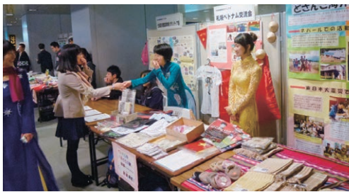
北海道NGOネットワーク協議会

その後、貧困問題を中心とした地球規模の課題は依然として解消されず、むしろ複雑化、巨大化しています。国際社会の中で、国益や企業による利益を優先した関係を続けていくには本当の平和は達成できないことから、市民参加の国際協力の輪を広げよう、と共感した皆さんの意思によりこの北海道NGOネットワーク協議会が作られ、約30団体の