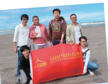
たくさんのごみを収集し充実した表情の中国の留学生たち

参加者が力を合わせて集めたごみは合計560kg。石狩の美しい自然に包まれながら活動に参加した一人ひとりの表情は、達成感に満ち溢れていた。