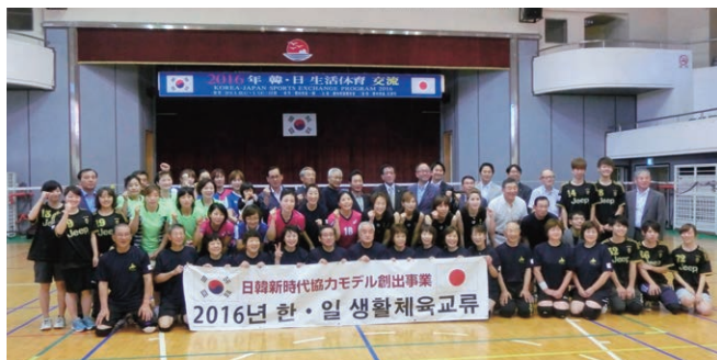
参加者全員で集合写真

HIECCでは、2012年から同協会の協力により、同じく高齢化が進んでいる韓国にミニバレーを紹介し、韓国における高齢者の健康増進や生き甲斐づくりなど、地域社会への貢献や、両地域との友好親善のため、これまで毎年、派遣・受入による交流を行ってきたところである。