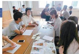
グループディスカッションの様子