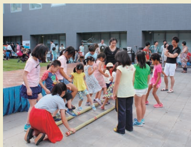
フィリピンのパンブーダンス。足を挟まれないように

JICA研修員(※)や札幌市の国際交流員など世界約30か国の在道外国人と来場者が交流を楽しめるイベント。アジアやアフリカ・中南米地域出身のJICA研修員に挨拶を教してもらいながら会話も楽しめるブースや、世界各国のゲーム体験、国際交流・協力を携わるNGOや札幌の姉妹都市紹介、また中庭でのダンスや歌のパフォーマンスなど、参画団体の特徴を生かした多種多様な企画が用意されていた。