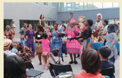
アフリカンドラムの音色に誘われ踊りの輪が広がる