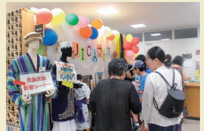
ワールドパスポートを手に各ブースへ

中庭での演目では、日本の大学生によるYOSAKOIソーランに始まり、民族衣装に身を包んだミャンマーの方々の歌の披露や、アクロバティックな動きのカボエイラ(音楽、ダンスの要素が入ったブラジルの格闘技)など迫力あるパフォーマンスが来場者を魅了。参加型の演目も多くあり、最初は躊躇していた子どもたちも各国の踊りにチャレンジしていた。最終演目のアフリカンドラムでは、会場に響き渡るリズムカルなドラムの音色に、自然と踊り始めるアフリカ出身のJICA研修員たち。次第に踊りの輪が広がり、大人も子どももステージ前でビートに合わせて自由に体を動かし、会場は一番の盛り上がりを見せていた。来場者にとって、短時間に世界を身近に感じられる有意義な一日となっていた。