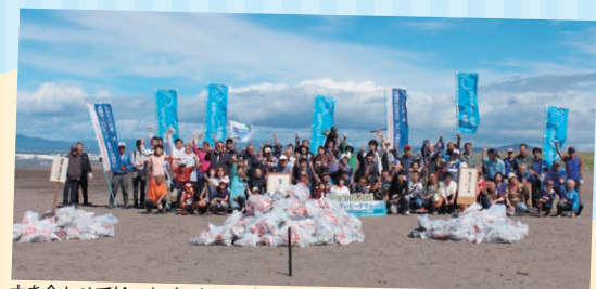
力を合わせて拾ったごみを前に全員で記念撮影