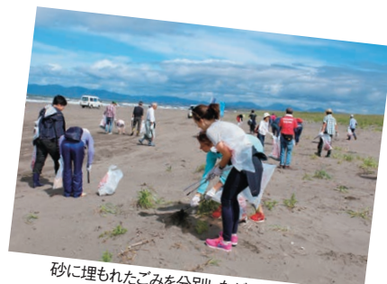
砂に埋もれたごみを分別しながら拾う参加者たち