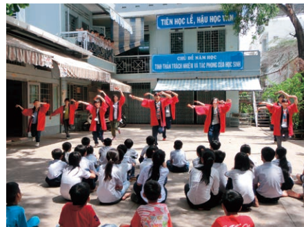
10人で心をつなぐ汗だくで踊った「よさこいソーラン」