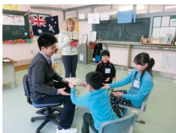
美国小学校4年生はオーストラリアのゲームに挑戦

土曜日は留学生が楽しみにしていた積丹町内見学。観光シーズンでなくても、神威岬から見た神秘的な夕陽に思わず息を飲み、温泉体験では入浴後のコーヒー牛乳を飲む庶民文化も嗜んでいた。宿泊先に到着すると、畳の部屋や新鮮な海の幸に感激し、町の方の歓迎の心に触れ、すっかり積丹町の魅力の虜になっていた。