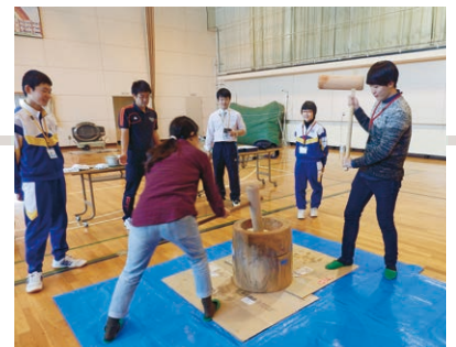
中学生の掛け声に合わせて餅をつく留学生

留学生にとっては全校生徒が9名ということや閉校ということが驚きだったようだが、今回の国際交流を楽しみにしていた中学生との出会いが、大学とは違う日本を知る素晴らしい機会になったと感想を語っていた。また、生徒たちは今回の経験を生かし、弁華別の誇りを胸に新しい舞台で未来に羽ばたいていくのだろう。