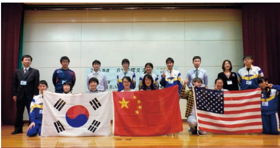
3カ国の国旗を囲んで全員で記念撮影

生徒代表による英語での歓迎挨拶でスタートし、次に留学生がパソコンを使ってそれぞれのお国を流暢な日本語で紹介。生徒たちは留学生が用意した写真やクイズに積極的に反応し、楽しみながら発表を聞いていた。