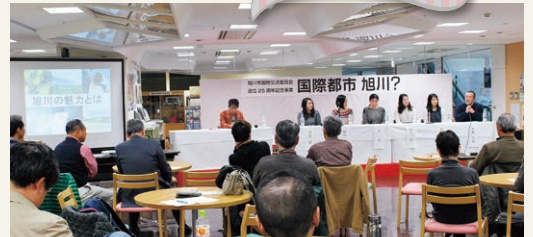
海外経験がある若い世代がパネリストとして登壇