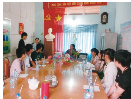
ベトナムの教育事情について話を聞く高校生

日本のNGOから支援を受けながら小学校に通う子どもたちにも出会った。無邪気に笑う子たちの中に笑顔を見せない一人の少年。その表情に最初は戸惑った。「自分たちという時間は楽しんでほしい!」と少しだけ勉強したベトナム語で話しかけボール遊びをすると、その子の顔に自然と笑みが。「頑張った甲斐があった!」と心から思った。しかし、後で母親が家出をしているという事実を知る。厳しい環境に置かれている子どもたちが、「もっと勉強して家族のためになりたい」と夢を語っていた姿を思い出し、自分たちがいつでも勉強できる環境にいるありがたみを痛感した。自分自身を見つめ直さなければならないことを、ベトナムの子どもたちとの出会いが教えてくれた。