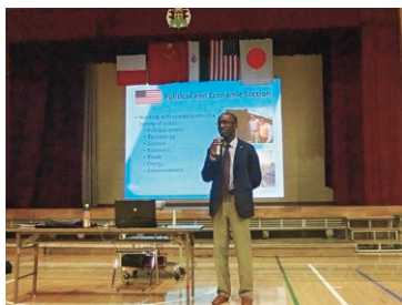
ビズリー領事のクイズで楽しく学べる内容に

今年で15回目となる「国際交流in 積丹」(主催：積丹町教育委員会)が11月21日(土)と22日(日)の2日間で行われ、イラン、スリランカ、オランダ、オーストラリア、フランス、中国、韓国、ブラジルなど11か国12名の留学生が同町を訪れた。また、美国中学校では在北海道外国公館・通商事務所等協議会が行う「学校訪問事業」も併せて行われた。