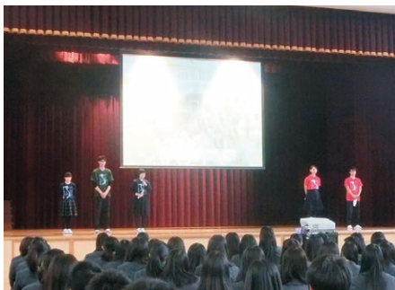
大人数の高校生を前にベトナムでの経験を語る高校生

8日間のスタディツアー中に学び、感じたことは十人十色。それぞれがベトナムで経験したことを胸に、それぞれの舞台でアジアの架け橋として活躍していくのだろう。