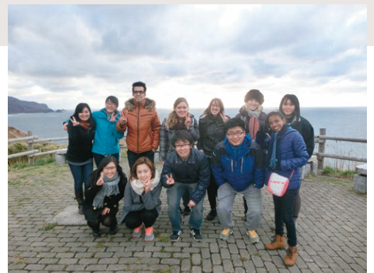
神威岬をバックに留学生全員で記念撮影

土曜日は留学生が楽しみにしていた積丹町内見学。観光シーズンでなくても、神威岬から見た神秘的な夕陽に思わず息を飲み、温泉体験では入浴後のコーヒー牛乳を飲む庶民文化も嗜んでいた。宿泊先に到着すると、畳の部屋や新鮮な海の幸に感激し、町の方の歓迎の心に触れ、すっかり積丹町の魅力の虜になっていた。