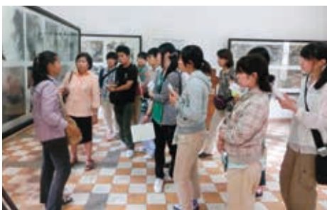
ガイドが語るカンボジアの歴史に心を痛めることも