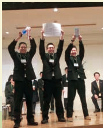
グランプリ獲得に喜びを爆発させる高校生チーム

各チームは制限時間7分間で、現在の滝川市の課題や問題点を分析したデータを用い、地域の未来のために何が出来るかを、チームワークを活かして発表。事前に何度も練習して臨んできた真摯な姿勢も伝わってきた。