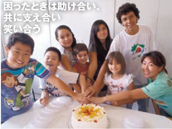
派遣地域の子どもたちと(右端が筆者)