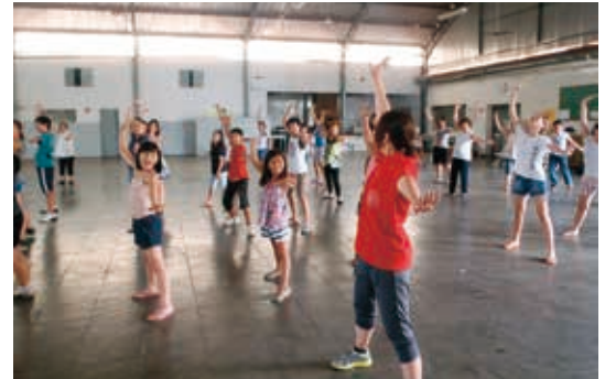
よさこいソーランを踊りながら日本を体感!