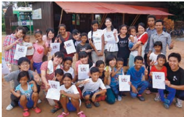
一生忘れられない子どもたちとの出会い

スタディツアー中は、毎日ホテルの部屋で振り返りの話し合いを行い、日々の中で感じた怒りや悲しみ、また喜びの感情をありのまま語り合い、現地でだからこそ悩み考えたことを仲間同士で深め合っていた。