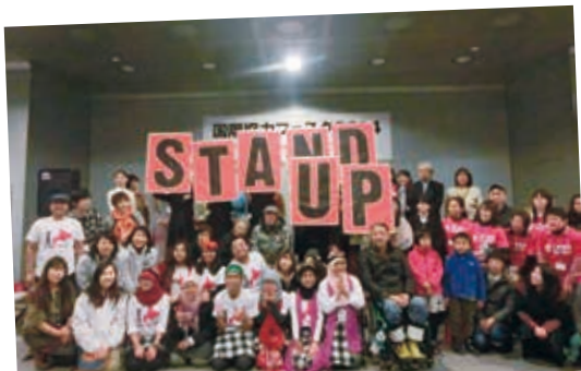
貧困解決を求め、来場者が「スタンド・アップ」に参加

会場には、世界を舞台に活躍するNGOの活動を紹介するパネルや、東南アジアの雑貨やアフリカのチョコレートやコーヒーなどのフェアトレード品を扱うチャリティバザーがあり、まるで北3条広場が異国の地のような雰囲気。