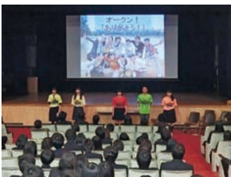
5人で心をつなぐ 室蘭市内の高校で報告会

スタディツアー中に一人ひとりが感じたことは様々。だからこそ、高校生がこれから築く「架け橋」には、未来の北海道とアジアを繋ぐ多様な可能性が秘められているかもしれない。