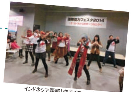
インドネシア語版「恋するフォーチュンクッキー」を踊る留学生

道内にあるNGO団体等からなる北海道NGOネットワーク協議会が中心となり、国際協力の魅力を一般市民に広めることを目的に、「国際協力フェスタ」が札幌駅地下歩行空間(通称：チカホ)で開催された。(主催：北海道NGOネットワーク協議会、共催：JICA北海道、協力：ハイエック等)