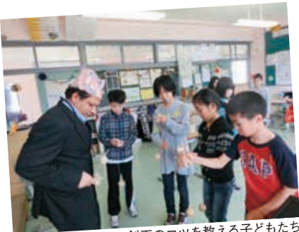
ネパールの留学生に剣玉のコツを教える子どもたち

当初、町内の観光名所である海岸や岬を1日目に見学予定だったが、あいにくの天候だったため、急ぎょニッカウヰスキー余市蒸留所を見学。創業当時から使われている機材や石造りの建造物に感激した様子で、家族用のプレゼントにウイスキーを購入する人も。その後、積丹町へ向かい、町の方の温かい歓迎やおもてなしの心に触れ、すぐに積丹町のファンになっていた。