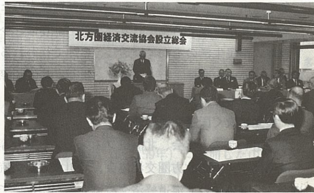
道内経済活性化に向けて北方圏経済交流協会の設立

ここに挙げた例が適切であるかどうか、または、本道の国際化を表わすものとして評価し得るかどうかは意見の分かれるところであろう。しかし、これらはすべて北方圏交流が北海道にもたらした変化であり、1つひとつの事象の中に含まれる発想は、それ以前のものとは大きな転換を経て出来上がったものであることだけは確かである。