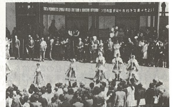
市民間の交流も盛んに…

その内容も多岐にわたり、衣・食・住などの生活に関する視察団、本道の文化あるいは日本の伝統文化紹介に関する使節団、各種スポーツ親善団や歩くスキー等の新しい冬のスポーツの研修団、学術提携に伴う数授や研究者の派遣、冬季技術等の研修団、サケを通じての少年少女の交流団、経済視察団、友好親善を目的