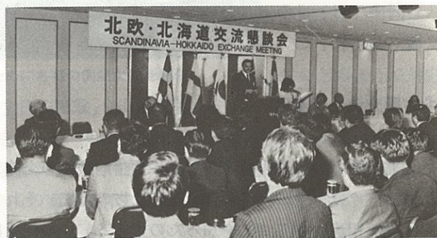
北 欧 と 北 海 道 の よ り 親 密 な 交 流 を …

このようにして生まれ、講想と体制を整えてきた北方圏交流はこの14年間に北海道の広範な分野、例えば、生活、文化、スポーツ、産業、経済など各界の人びとの中に浸透し、また、本道の各地に輪をひろげつつある。その状況は少しく詳細に後で述べることにするが、道内各地の各界、各層によって行われている交流活動の件